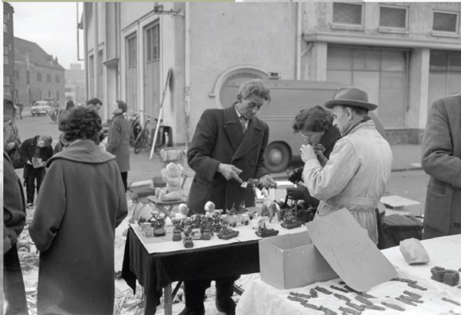
Foto: Een markttag op het Mariëburg in Sinterklaastijid 1955

En van deze opnames hebben we een compilatiefilm gemaakt. Ook heeft één van onze filmers de Lourdeskerk op film vastgelegd. In 2022 werd besloten dat de kerk per 1 januari 2023 zou gaan sluiten. Maar omdat de kerk in 2025 honderd jaar bestaat heeft het kerkbestuur besloten dat het jubileum van het kerkgebouw nog mag worden gevierd.