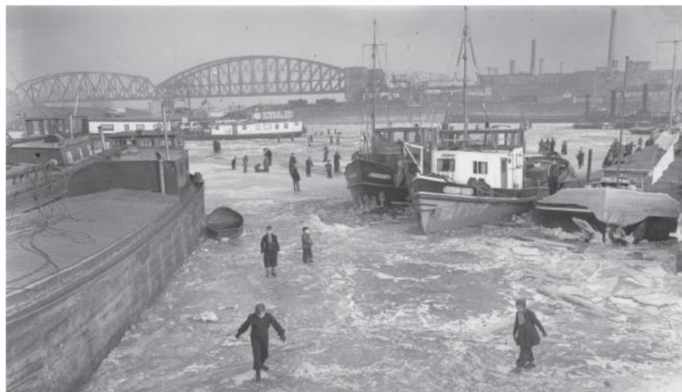
Foto: De dichtgevroren Waalhaven in 1954