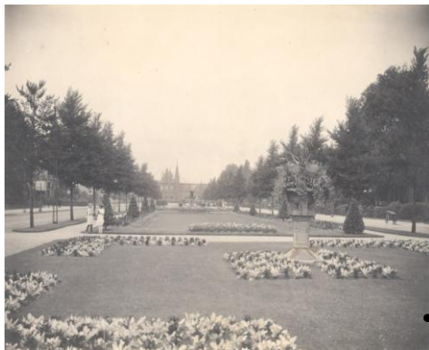
De Van Schaeck Mathonsingel in 1925